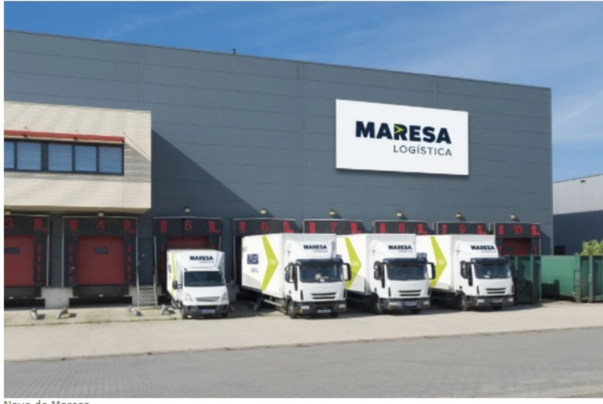
Nave de Maresa.

LOGÍSTICA PROFESIONAL | Viernes, 13 de marzo de 2020, 10:00