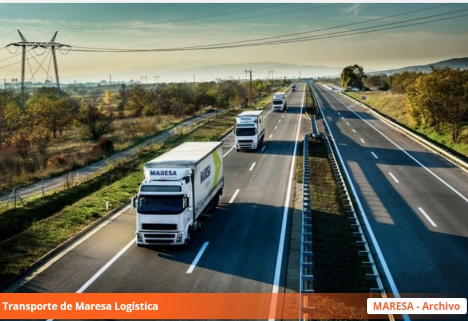
Transporte de Maresa Logística